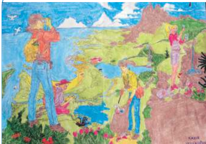
Kučuk Kadir I mjesto, Tehnika: kreda u boji

BILTEN OPĆINE TRNOVO Besplatan primjerak • broj 10 • mart 2012.