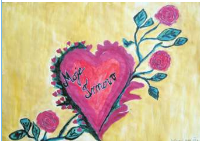
Diad Šaćirović III mjesto, Tehnika: tempera

TAKMIČENJE UČENIKA OŠ „ZAIM KOLAR” DEJČIĆI U LIKOVNIM RADOVIMA